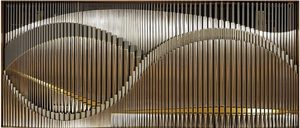
Abb.2: Orgelprospekt der Ouverture Hall in Madison WI (USA)

Auch bei der Orgel in Zug (CH) (Abb. 3) sind die Labien in geraden Linien angeordnet, aber hier sieht man die Oberenden der Pfeifen nicht. Wie lang die Pfeifen wohl sind? Welche Kurve die Oberenden wohl bilden? Wenn man die Tonhöhen der betreffenden Pfeifen einer Pfeifengruppe kennt, könnte man daraus die oben entstehende Kurve konstruieren (siehe auch Teil 4 zu den Längenverhältnissen der Pfeifen).