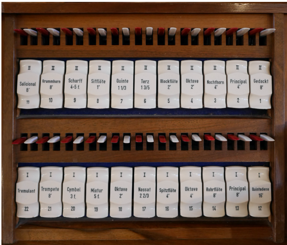
Abb. 4: Register der Sophienkirchenorgel in Berlin-Mitte

https://die-orgelseite.de/fusszahlen.htm