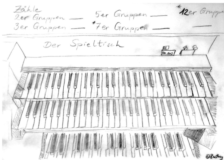
Abb. 1: Spieltisch einer Orgel - Zeichnung: Susanne Barbey

Auch für die Sekundarstufe ist das schnelle Erfassen der sich wiederholenden Muster und ein dadurch erleichtertes Abzählen lohnend. Insbesondere können sich hier weitergehende Betrachtungen zu zahlentheoretischen Fragen (Zerlegung, Teiler und Primfaktoren) entwickeln.