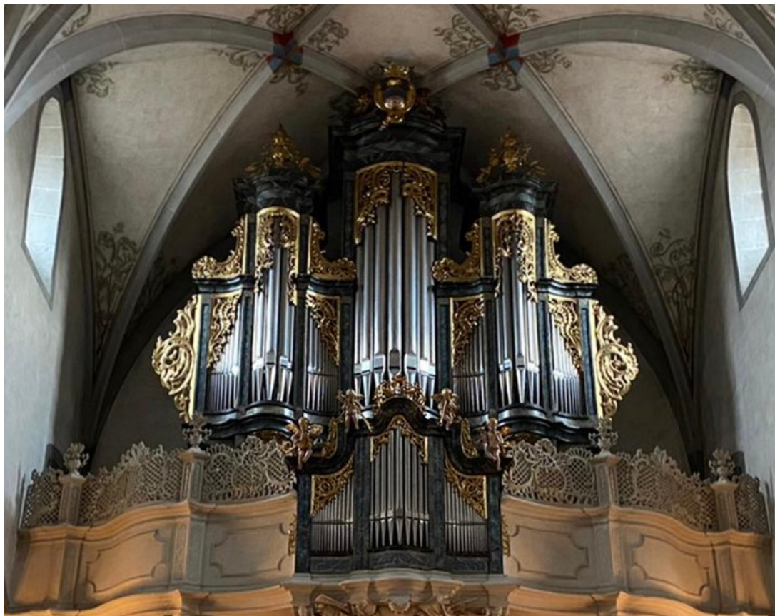
Abb. 3: Orgel in der Kirche St. Oswald in Zug (CH)

Auch bei der Orgel in Zug (CH) (Abb. 3) sind die Labien in geraden Linien angeordnet, aber hier sieht man die Oberenden der Pfeifen nicht. Wie lang die Pfeifen wohl sind? Welche Kurve die Oberenden wohl bilden? Wenn man die Tonhöhen der betreffenden Pfeifen einer Pfeifengruppe kennt, könnte man daraus die oben entstehende Kurve konstruieren (siehe auch Teil 4 zu den Längenverhältnissen der Pfeifen).